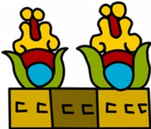
Imagen 2. Glifo de Xochimilco